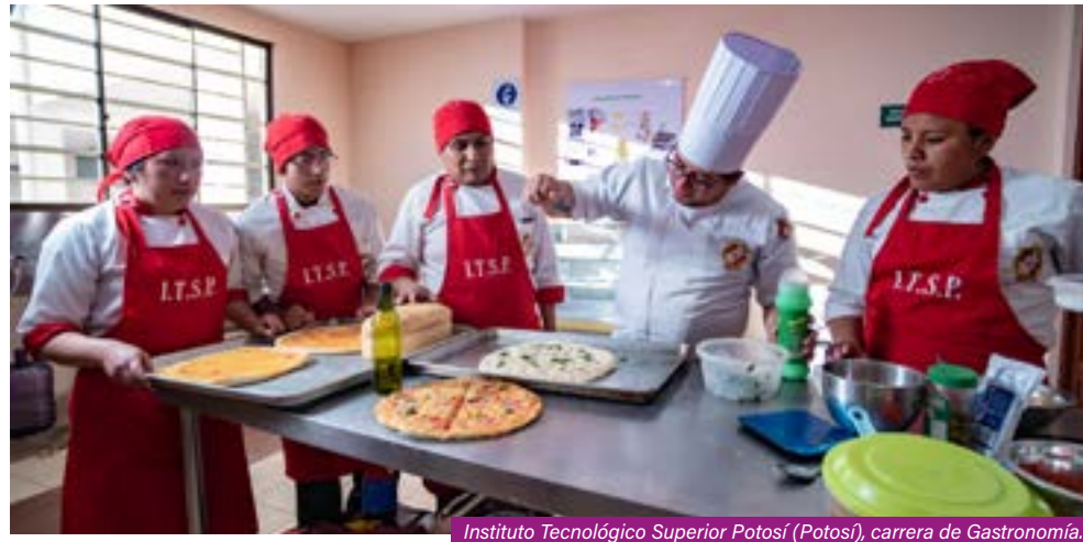
Instituto Tecnológico Superior Potosí (Potosí), carrera de Gastronomía.

La estrategia de género implementada en el proyecto ha sido fundamental para impulsar la igualdad y la equidad de oportunidades entre hombres y mujeres.