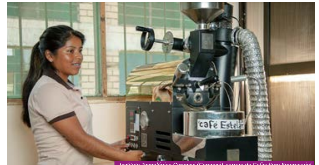
Instituto Tecnológico Caranavi (Caranavi), carrera de Caficultura Empresarial.

La prevención de la violencia en razón de género debe ser una tarea sostenida que supone el compromiso de los centros de formación para garantizar el tratamiento de este tema en todos los espacios posibles. Requiere además una permanente articulación con instancias y entidades especializadas para crear sinergias, que puedan lograr un mayor impacto en las acciones que se emprendan.