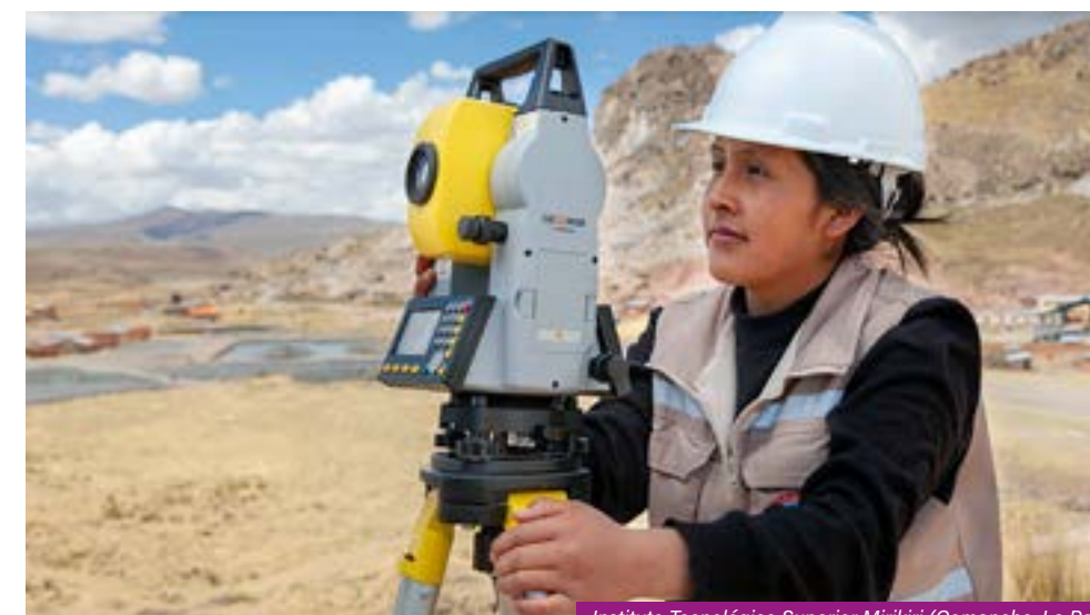
Instituto Tecnológico Superior Mirikiri (Comanche, La Paz) carrera de Recursos Hídricos - Orientación Riego.

El proyecto adopta los enfoques de gestión por resultados, sistémico, territorial, y de desarrollo de capacidades. La equidad de género y la gobernabilidad constituyen temas transversales a las acciones a desarrollarse.