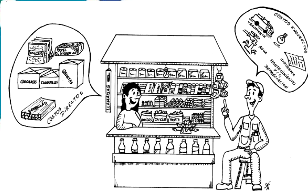
Negocio de Comercio