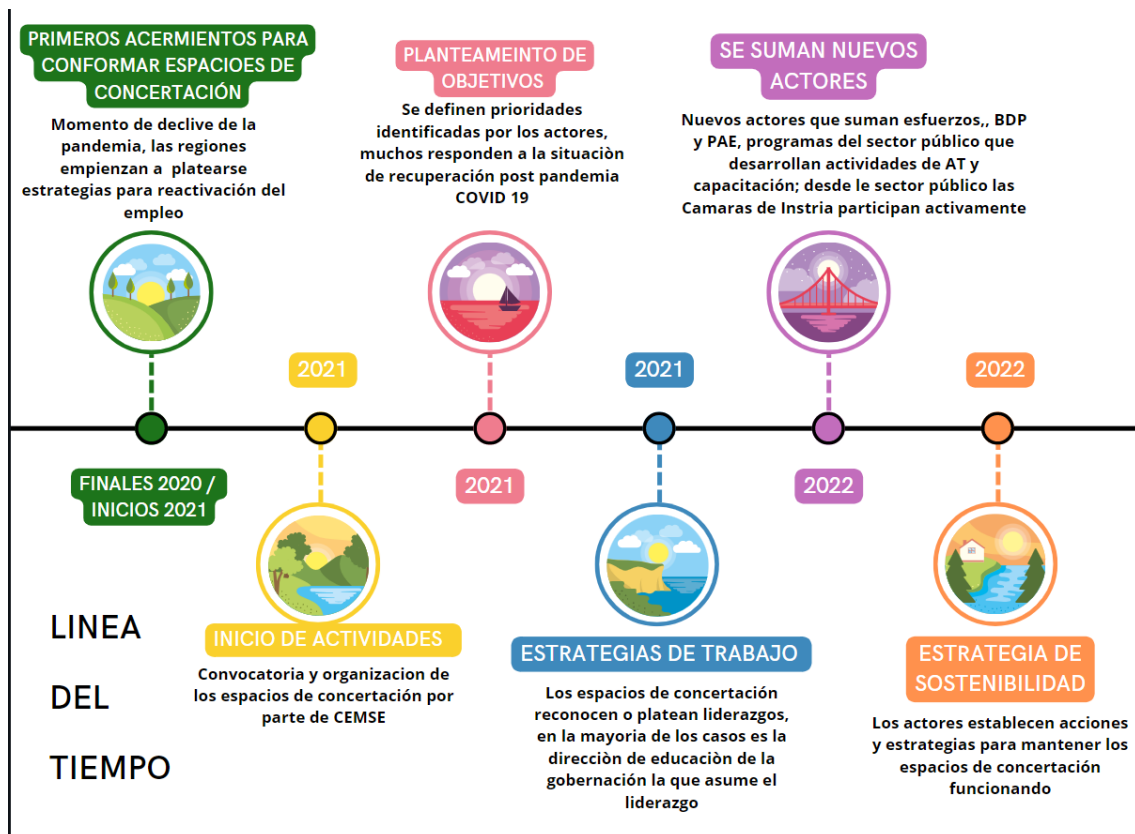
Grafico1: Línea de tiempo espacios de concertación.