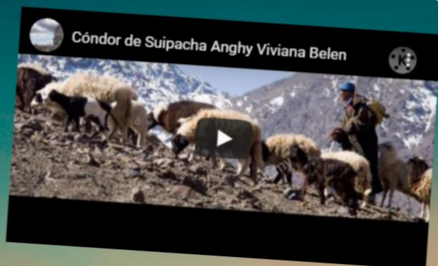
Condor de Suipacha Anghy Viviana Belén

Creatividad de los y las estudiantes, demostrando que pueden realizar más de lo que se esperaba, superando, en algunos casos, las expectativas.